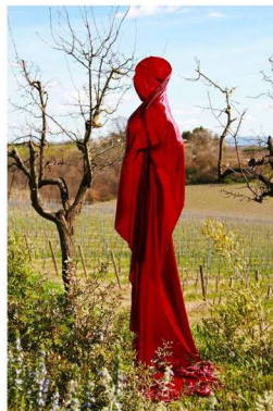
Poggio del Moro